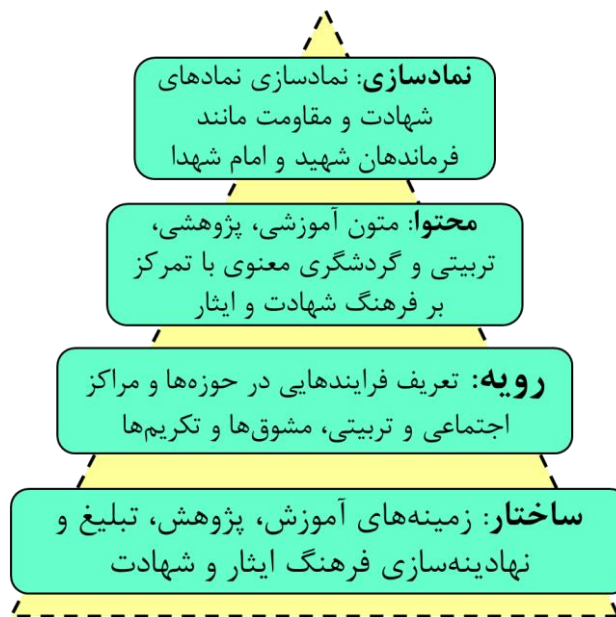
شکل ۱. عوامل کلیدی در ساختار، رویه و محتوا و نمادسازی در ترویج فرهنگ ایثار و شهادت (نگارنده)

فرهنگ شهادت، مجموعه‌ای از اعتقادات و آموزه‌هایی است که باعث شکل‌گیری روحیه شجاعت، مبارزه و جهاد در راه خدای متعال و نهایتاً کشته شدن در راه ایمان و عقیده است. محور اصلی این فرهنگ نیز همان شهید و انگیزه‌های متقن و مقدسی است که او را به سمت شهادت‌طلبی سوق می‌دهد (پژوهشگاه فرهنگ و هنر و ارتباطات، ۱۳۸۱). ترویج فرهنگ ایثار و شهادت، رایج کردن ارزش‌ها و هنجارهای بذل و بخشش تا مرتبه جان، آداب و رسوم از خود گذشتگی و جان فشانی شهدا و خلق‌های ایثارگران و شهدا برای توسعه اسلامی انسان‌ها، به صورت مستقیم (رو در رو) یا غیرمستقیم (غیرحضور) با ایجاد تغییر ملموس در جامعه را ترویج فرهنگ ایثار و شهادت گویند (مسعودی و همکاران، ۱۳۹۴، ص ۹۲). عوامل اصلی و مهم در ترویج فرهنگ ایثار و شهادت شامل نیروزمینه‌های آموزش، پژوهش، تبلیغ و نهادینه‌سازی فرهنگ ایثار، تعریف فرایندهای اجتماعی-تربیتی و مشوق‌ها، تالیف متون آموزشی-پژوهشی و رسانه‌ای و نمادسازی در الگوهای ایثار، مقاومت و شهادت است (شکل ۱).